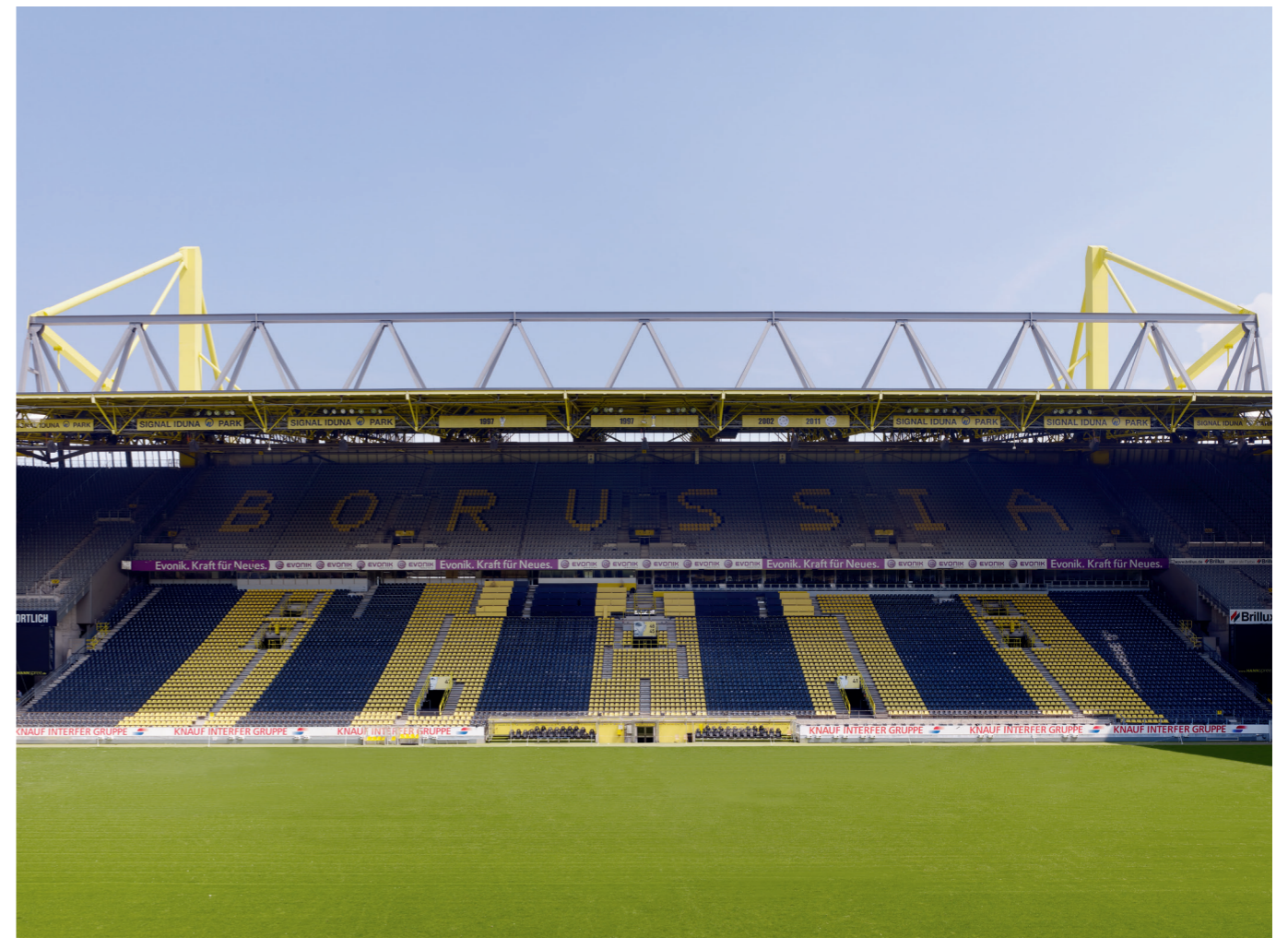
Osttribüne mit Mannschaftsbank

Das aktuelle Fassungsvermögen des Stadions liegt heute bei 80.645 Zuschauern.